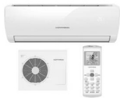
Kondisioner Hoffmann ASW-H09A4/FAR1