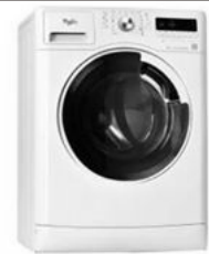
Paltaryuyan Whirlpool AWIC 8914