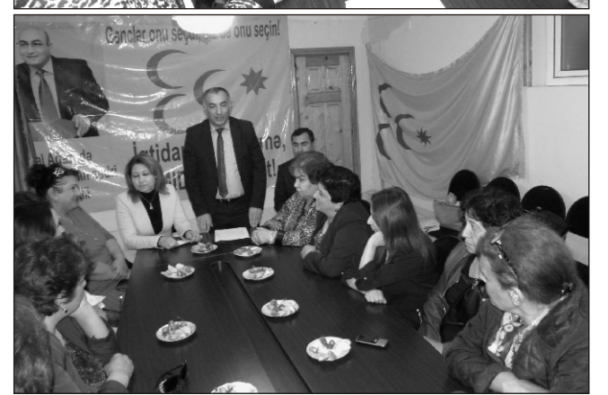
Sonda Qadınlar Təşkilatının Məclisinin formalaşması üçün 17 nəfərdən ibarət Təşkilat Komitəsi yaradılıb.

Bu səhifə Ümid Partiyası tərəfindən təqdim edilmişdir