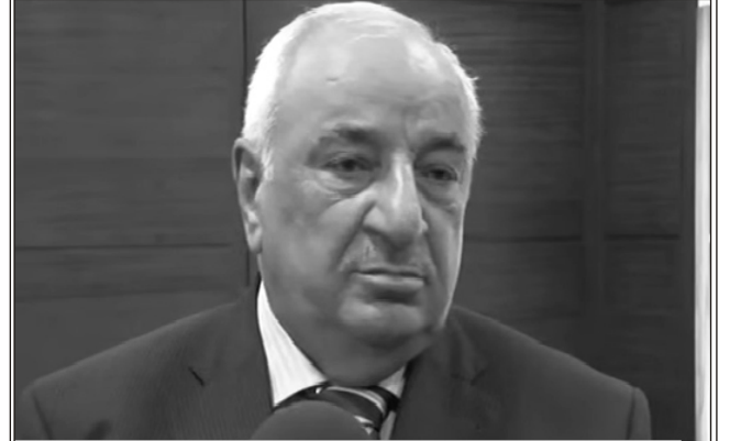
Ankarada baş verən terror hadisəsinə münasibət bildirərkən ağlayan Abid Şərifov

Baş nazirin müavini Abid Şərifov mətbuat qarşısında emosional davranışları ilə tez-tez gündəmə gəlir. Şərifov yerli medianın jurnalistlərinin zənglərini açmasa da, onlarla bir çox hallarda kobud danışsa da, xarici KİV-in qarşısında özünü fərqli yöndən göstərir.