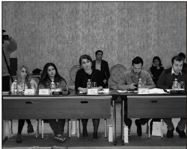
Təmsil edən 25 jurnalist iştirak edib.

A prelin 14-də Təhsil Nazirliyinin təşkilatçılığı ilə nazirliklə əməkdaşlıq edən KİV-in nümayəndələri üçün təhsil sahəsinə dair maarifləndirici təlimə start verilib. Müsavat.com xəbər verir ki, təlimdə televiziya kanalları, qəzetləri və xəbər agentliklərini