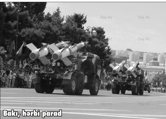
Bakı, hərbi parad

A zərbaycan öz ərazilərinin işğal altında olmasını nəzərə alaraq hər il hərbi büdcəsini artırır, ordusunu ən müasir silah-sursatla təmin etməyə çalışır. Bu, ölkəmizin doğulmuş qoşunu. Çünki bütövlüklü pozulmuş istənilən ölkə öz müdafiə qabiliyyətini yüksəltməklə bərabər, hücum ordusu qurmağa səy edir. Əfsus ki, torpaqlarımızın qeyd-şərtsiz boşaldılmasını tələb edən BMT, Avropa Şurası və Avroparlamentin qətnamələri hələ də kağız üzərində qalıb. Hələ ki, münaqişənin dinc nizamlanması ilə məşğul olan böyük gücləri də erməni təcavüzünə son qoymaq, Azərbaycanın ədalətli tələblərinin yerinə yetirmək maraqlandırır.