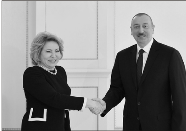
yata keçirilən iqtisadi, nəqliyyat, energetika sahələrində əməkdaşlıq üzrə bir neçə yol xəritəsi mövcuddur. Təsadüfi

ğunu bildirib ki, bu, iki ölkə arasında dostluq əlaqələrinin daha da möhkəmlənməsinə təkan verəcək: "Əlaqələr çoxplanlıdır, həyatın demək olar ki, bütün sahələrini əhatə edir və yaxşı dinamikaya malikdir. Biz siyasi sahədə fəal qarşılıqlı fəaliyyət göstəririk, iqtisadi potensialı artırırıq, uğurla hə-