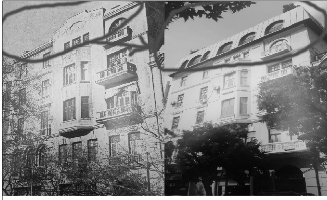
Həmin yerin köhnə görkəmi İndiki. Tarixi abidəni «peredelka» ediblər

Bu məsələdə qəribə olan detallardan biri də başqa vaxt "bahalı avtomobillərdə şütüyən harın gənclər"i itiham edən, onların lüks həyat tərzi pisləyən şəxslərin birdən-birə sosial şəbəkədə onlara qahmar çıxması, lüks