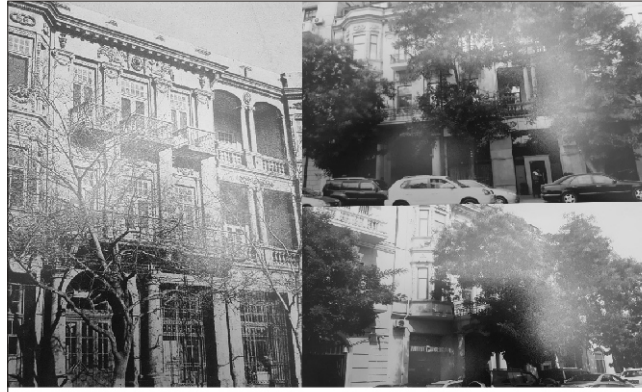
Əvvəllər Natəvan klubu olan yerin indiki durumu

eməllərinə paytaxt meri "dur" deyibse, onu bu məsələdə tənqid yox, təqdir etmək lazımdır.