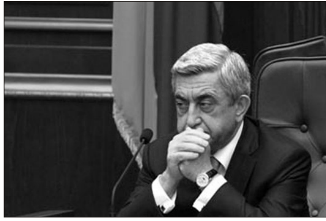
Martin 25-dək davam edəcək Türkiyə-Azərbaycan birgə hərbi təlimləri düşmən ölkəni ciddi narahat edir