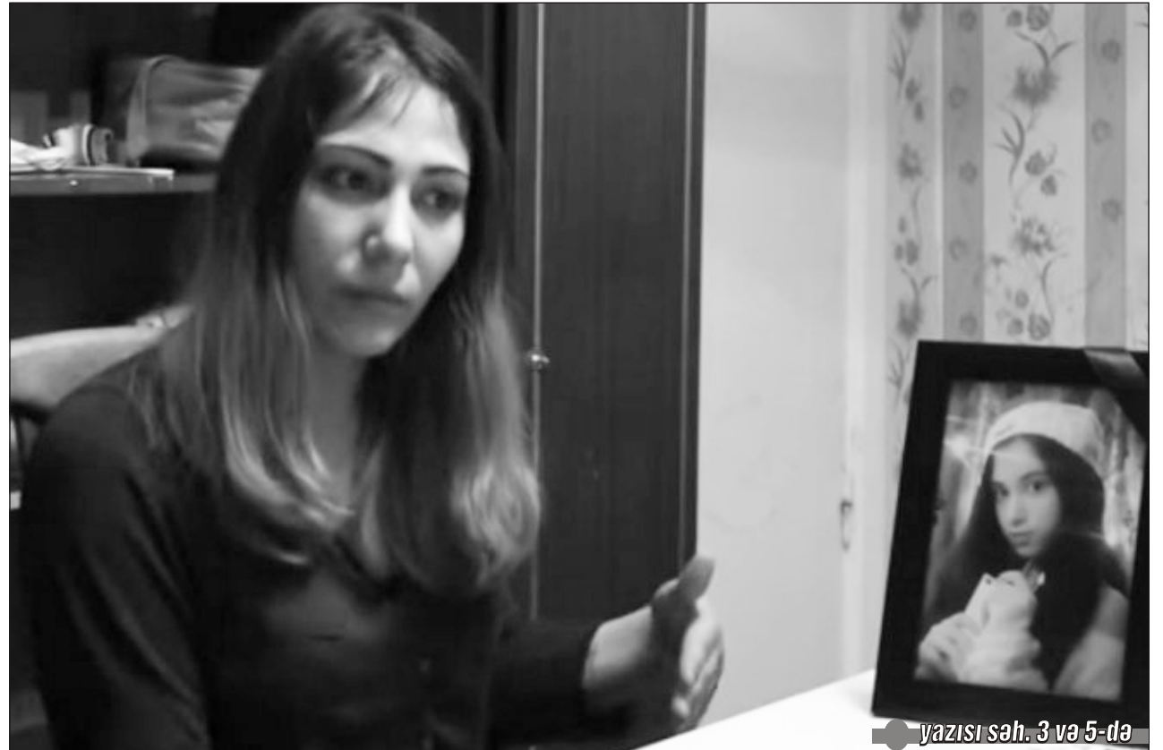
yazısı səh. 3 və 5-də

Təhsil nazirinin iştirakı ilə keçirilən iclasda 162 nömrəli məktəbin direktoru ilə bağlı qərar verildi; cəmiyyətdə geniş rezonans doğuran hadisə deputatların və media təmsilçilərinin iştirakı ilə geniş müzakirə edildi; mərhum Elina Hacıyevanın anası yayılan videonu yalanladı: "Ölmüş bir qız uşağını bu şəkildə ləkələmək nə qədər insanlıqdandır?"