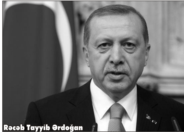
Rəcəb Tayyib Ərdoğan

"Putin kimi şəxslər ancaq güc dilini başa düşürlər"