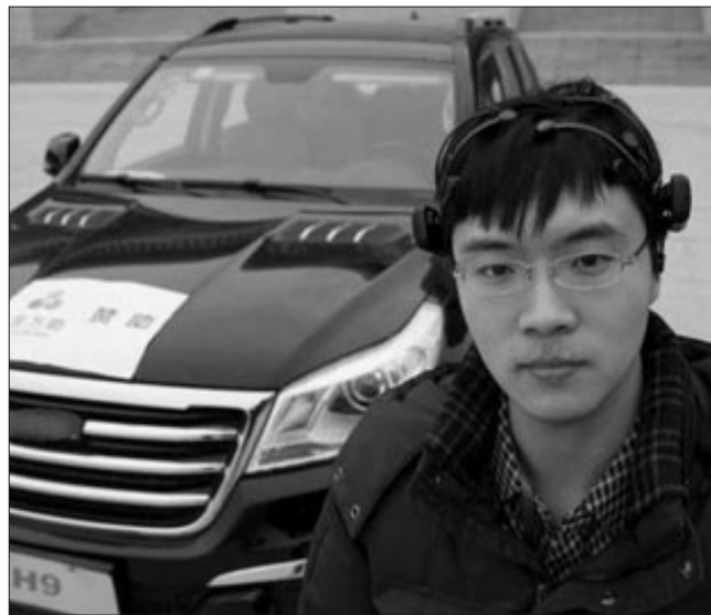
Hazırda üzərində müəyyən texniki işlər aparılan avtomobillər nə zaman insanların istifadəsinə veriləcəyi məlum deyil.

Çinli ixtiraçılar beyin gücü ilə işləyən avtomobil hazırlayıblar. Hər kəsin marağına səbəb olan ixtiralar sırasına çinli ixtiraçıların ərsəyə gətirdiyi yeni beyin gücü ilə çalışan avtomobillər daxil edilib. Dünya sürücüsüz avtomobillər ixtira etməyə çalışdığı bir vaxtda Çinin Tianşin şəhərindəki Nankai Universtetinin ixtiraçıları tərəfindən hazırlanan bu avtomobil, beyindən ötürülən dalğalar vasitəsilə irəli-geri sürmək və qapılarını açıb-bağlamaq mümkün olacaq.