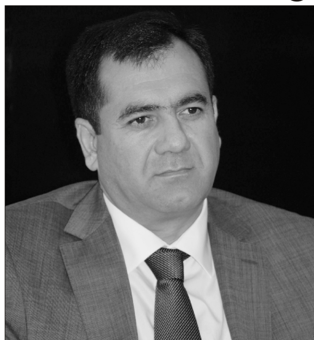
"Azərbaycan Ermənistanla ərazi mübadiləsinə də gedə bilər"

- Mən hesab edirəm ki, burada bir anlaşma var idi. Yəni Rusiya Minsk Qrupunun həmsədrləri ilə razılışmışdı ki, Ermənistanı maksimalist mövqedən bir az geri çəksinlər, heç olmasa Dağlıq Qarabağın mərhələli şəkildə qoparılmasına razılıq versin. Amma Ermənistan birmənalı şəkildə tələb edir ki, Azərbaycan maksimum 5 il ərzində orada referendum keçirilməsinə razılıq verməlidir. Ona görə də məncə, burada bir razılışdırılmış mövqeyə ortada idi. Böyük dövlətlər də bəzən müəyyən realılıqlarla razılışmaq