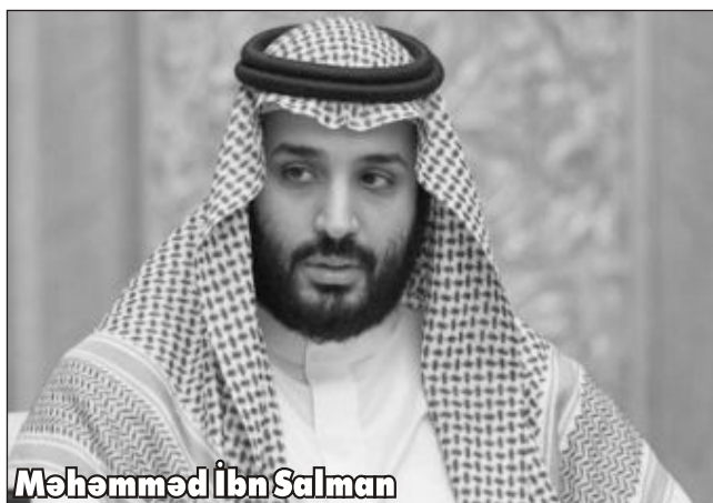
Məhəmməd İbn Salman

Qeyd edək ki, son iki ildə hakimiyyət pillələrində sürətlə irəliləyən Məhəmməd bin Salman taxt-tacın növbəti sahibi hesab olunur. Hazırda vəli-