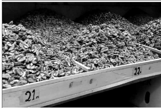
Quru meyvələrə gəlincə, qərzəkli qozun kiloqramı 6 manat, şabalıd 7 manatdır. Ləpələrdən badam və qozun qiyməti "ceyran belinə qalxıb", kiloqramı 21-22 manata satılır. Fındıq