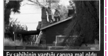
Ev sahibinin yaptığı canına mal oldu HİRSİZ BACAYA SIKIŞINCA...

Amerikada oğurluq üçün bir evə girməyə çalışan oğru faciəvi şəkildə həyatını itirib. ABŞ-ın Kaliforniya ştatında baş verən hadisə zamanı oğru evə bacadan girməyə çalışıb. Lakin bacadan keçə bilməyib. Bacada sıxışmış qalan çağırılmamış qonaq nə evə girə bilib, nə də geri qayıda.